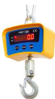
Рис. 1 ВЭК/1-[X]

Общий вид весов крановых ВЭК представлен на рисунках 1-8.