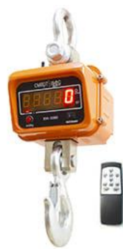
Рис. 3 ВЭК/3-[X]