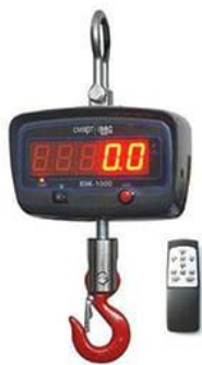
Рис. 2 ВЭК/2-[X]