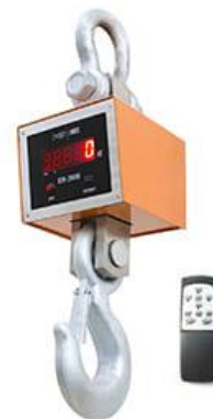
Рис. 4 ВЭК/4-[X]