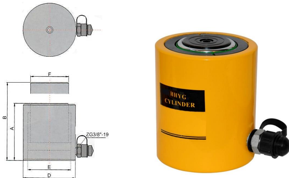
Рисунок 1. Домкрат гидравлический ННУГ.